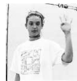
4 touches de balle