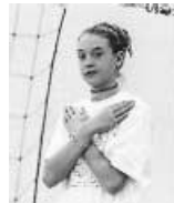
Fin de set et de match