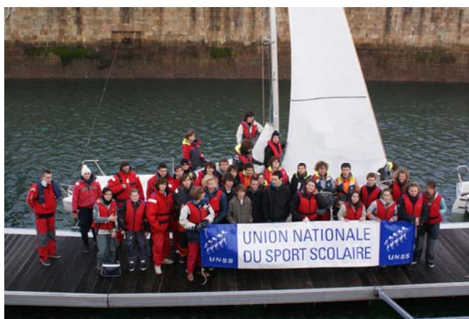
Championnat départemental à Cherbourg