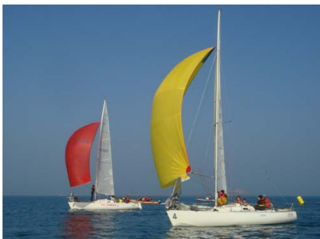
First Class 8